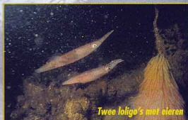
Twee lofoga's met eieren

Sommige dieren zie je alleen met nachtduiken, andere manifesteren zich alleen in de paartijd en sterven daarna af. Vaak komen de mooiste dieren speciaal naar de Oosterschelde om te paaien en hun eieren af te zetten, zoals de staalfis en de inktvissen. De kraamkamer is een belangrijke functie van de Oosterschelde! Ook als je al wat langer duikt, zijn er steeds weer nieuwe ontdekkingen