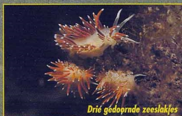
Drie gedopnde zeeslakjes