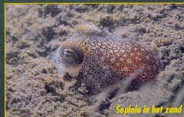
Sepiolo in het zand